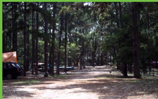
Vista do camping

Nesta oportunidade também foi assinada a Autorização Ambiental Nº 001/2008/UG-PERV/DPEC, autorizando a UEB-SC a efetuar as melhorias na rede elétrica; limpeza das valas de drenagem; colocação de lixeiras para coleta seletiva e desbaste de espécie vegetal exótica na área do Campo Escoteiro, conforme projetos apresentados pela UEB-SC à FATMA.